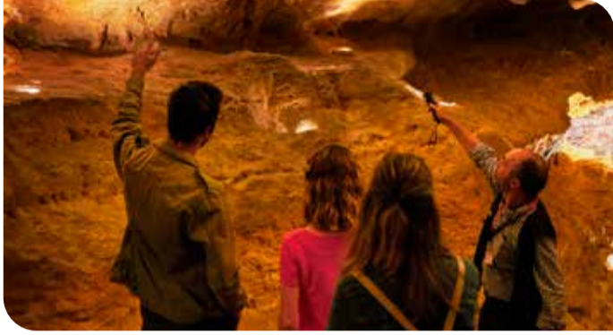
LASCAUX 4

Avec une avant saison maussade, la saison touristique 2021 partait du mauvais pied... Et pourtant, la Dordogne a bien tiré son épingle du jeu et les résultats du cru estival 2021 se sont avérés à la hauteur des espérances.