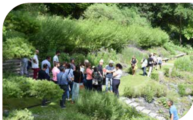
Visite des Jardins de l'Imaginaire à Terrasson-Lavilledieu (voyage d'étude VVF)

Au-delà du fleurissement, ces labels récompensent une vision globale d'aménagement des espaces élaborée par les élus locaux et mise en œuvre par les agents des collectivités et les particuliers. Cette orientation s'inscrit en résonance parfaite avec la stratégie départementale d'excellence environnementale et concourt à valoriser l'image de la Dordogne, à favoriser son développement touristique et à dynamiser son économie.