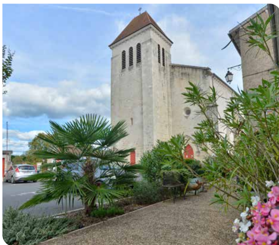
Aménagement de la place de l'église de Saint-Germain du Salembre

Pour la période 2016-2020, le Département aura ainsi financé à hauteur de 11 221 890 € des travaux d'aménagement à ce double titre.