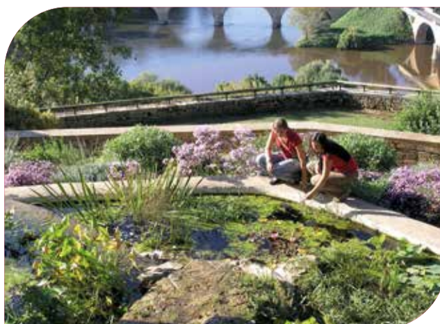
Limeuil, vue depuis les jardins panoramiques