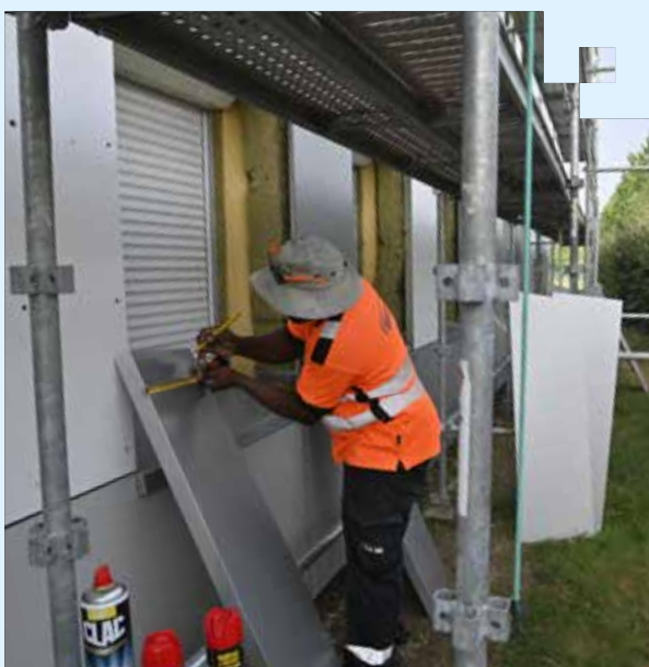
Travaux d'isolation extérieure du collège Jacques Prévert à Bergerac

En parallèle, des chaufferies bois sont installées pour remplacer les vieilles chaudières à fioul.