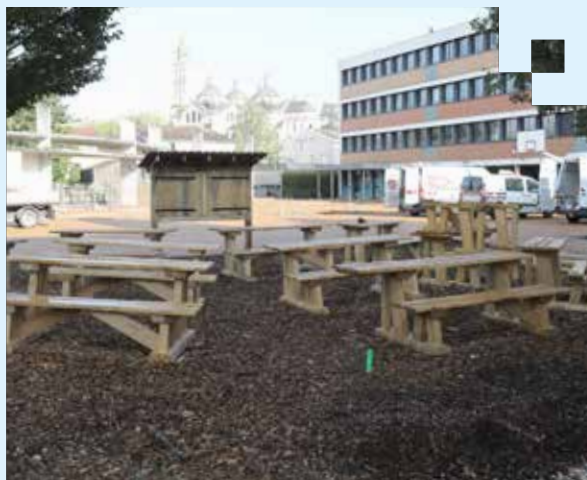
Aménagement de la cour du collège Montaigne à Périgueux