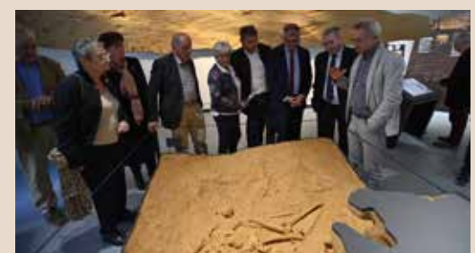
Inauguration de l'exposition le 4 octobre 2024