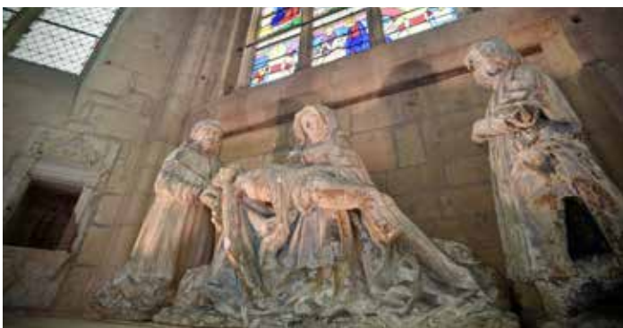
La Pietà dans son emplacement d'origine dans la chapelle du château de Biron.