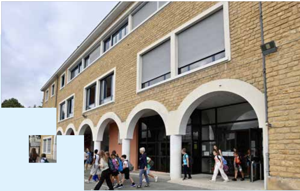
Collège Yvon Delbos à Montignac-Lascaux

Restauration scolaire, bâtiments ou encore entretien des établissements, le Département est un acteur majeur du quotidien des collégiens de Dordogne. C'est la raison pour laquelle il porte une attention toute particulière à proposer aux élèves les meilleures conditions d'apprentissage, essentielles à leur bien-être, tout en mettant en œuvre des projets innovants, notamment en matière d'excellence environnementale.