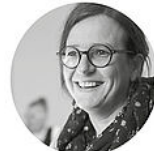
Stéphanie J · Cabane Graphique