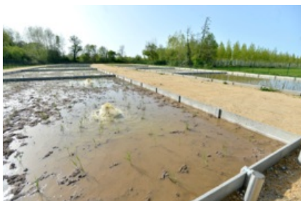
Une station d'épuration avec filtres plantés de roseaux à Saint-Aulaye

Le Département accompagne les collectivités dans l'élaboration de leurs projets d'assainissement collectif en menant une mission d'appui tant technique, qu'administratif et juridique. Le rôle est assuré par le service des politiques de l'eau qui développe une ingénierie sur l'ensemble du territoire.