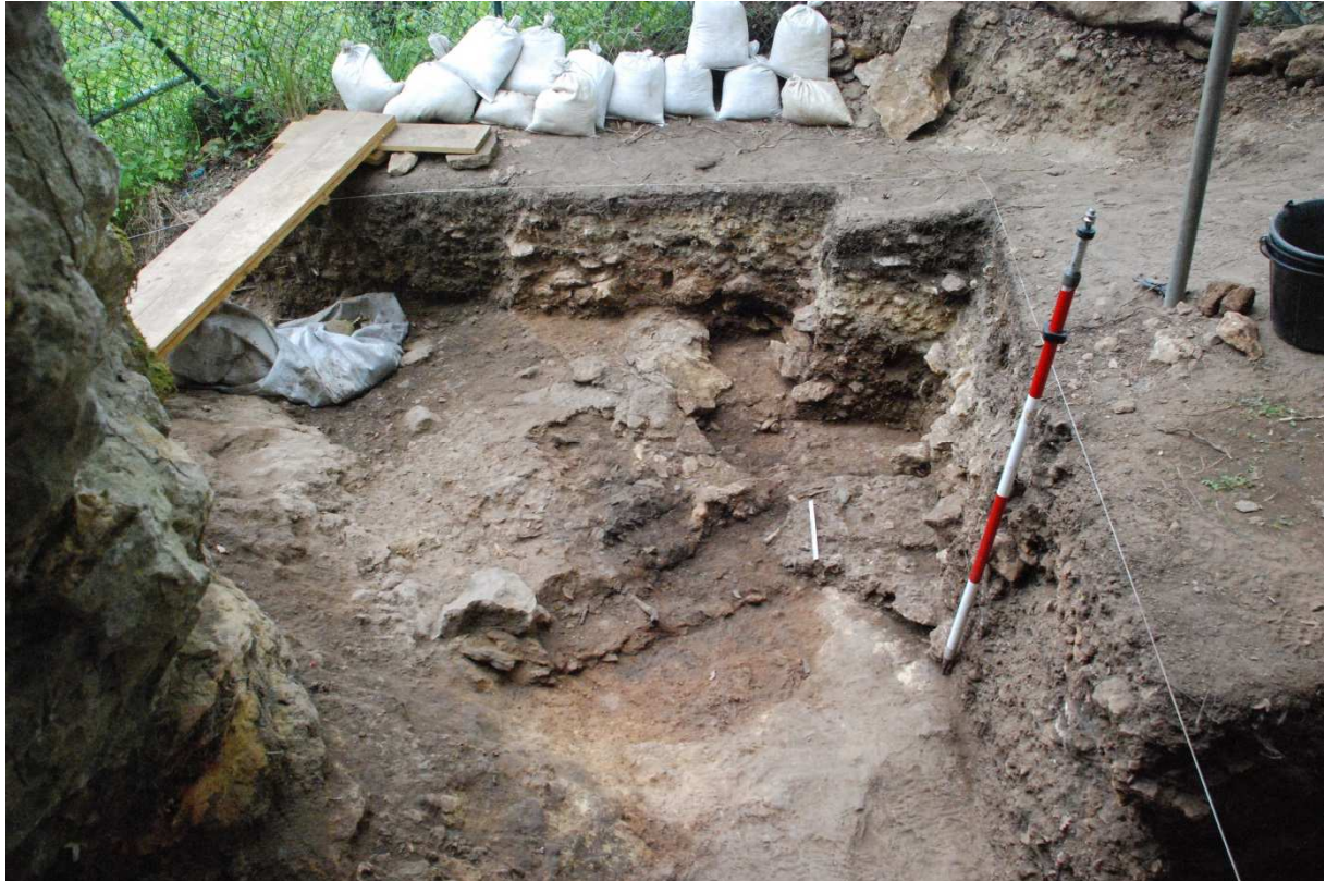
Fig. 1 : La Ferrassie, vue du secteur fouillé dans la partie avant de la terrasse faisant face à la grotte.