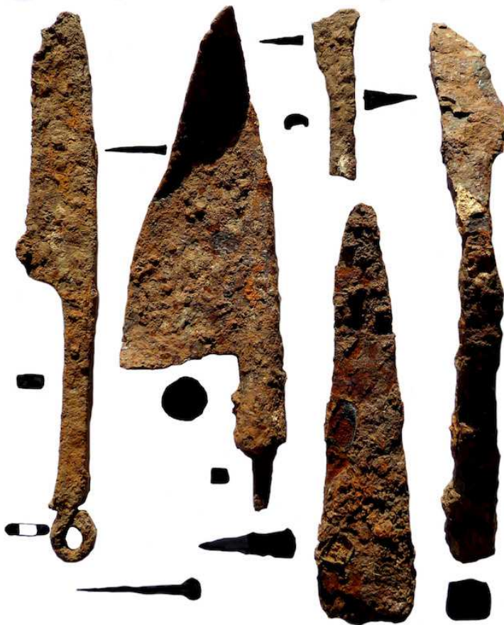
2. Couteaux en fer de La Peyrouse (IIIe-Ier siècles av. J.-C.).