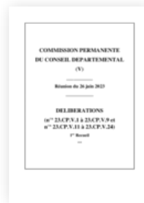
Commission permanente 26 juin 2023