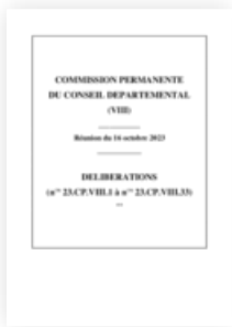
2023 Commission permanente 16 octobre 2023