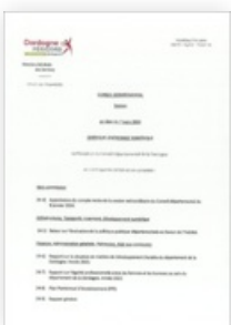
2024 Certificat d'affichage des Orientations Budgétaires 2024