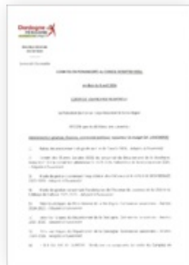
2024 Commission Permanente du 8 avril 2024