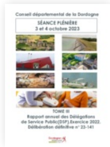
2023 Recueils de la séance plénière des 3 et 4 octobre 2023