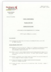
2024 Certificat d'affichage Budget Primitif 2024