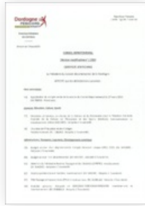
2024 Certificat d'affichage Décision modificative n° 1