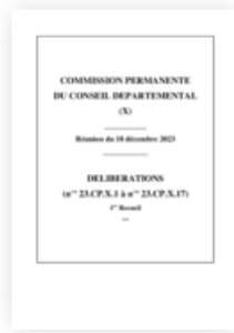
2023 Commission permanente 18 décembre 2023