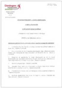
2024 Certificat d'affichage Commission Permanente du 15 juillet 2024