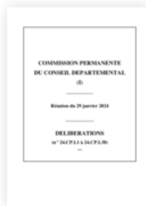
2024 Commission Permanente du 29 janvier 2024