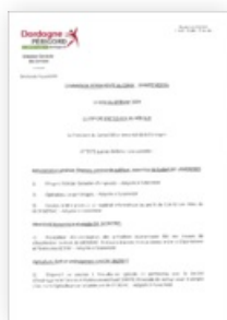
2024 Commission Permanente du 19 février 2024