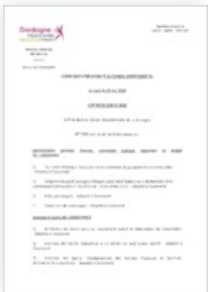
2024 Commission Permanente du 21 mai 2024