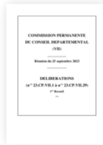
2023 Commission permanente 25 septembre 2023