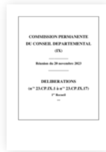
2023 Commission Permanente 20 novembre 2023