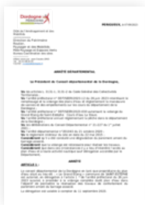
2023 Arrêté Départemental interdisant l'accès au plan d'eau de ST ESTEPHE ainsi que toutes les activités nautique à partir du lundi 11 septembre 2023