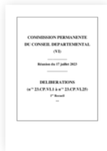
2023 Commission permanente 17 juillet 2023