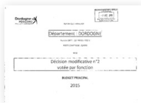
2015 Décisions modificatives pour l'exercice 2015