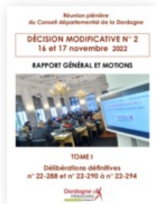
2022 Décision modificative n°2 pour l'exercice 2022