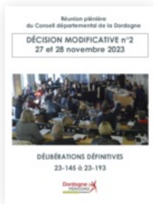
2023 Décision modificative n°2 pour l'exercice 2023